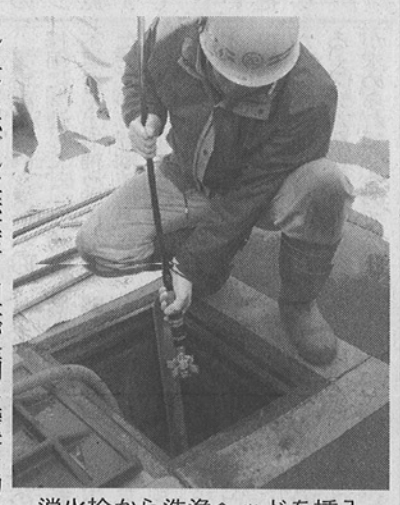
消火栓から洗浄ヘッドを挿入